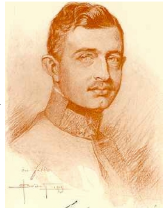
Sua Maestà Imperiale Reale Apostolica Carlo d'Asburgo (1887-1922), ultimo Imperatore d'Austria, morto esule, in concetto di santità, nell'isola di Madera. Sarà proclamato Beato da Giovanni Paolo II il 3 ottobre prossimo in Piazza San Pietro.