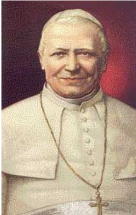
Il Beato Papa Pio IX, regnò sul soglio di Pietro dal 1846 al 1878.

★ Il 20 settembre 1870 le truppe dello Stato liberal-massonico sabauda entravano a cannonate nella Roma cattolica, allora Stato autonomo, libero e legittimo. I paladini della "tolleranza" e della "libertà" uccisero i soldati del Beato Pio IX, come avevano già assassinato il ministro del Papa, Pellegrino Rossi. Si compiva così quella pagina nerissima che fu il Risorgimento italiano, fatto di usurpazioni contro Stati secolari e i loro legittimi sovrani, di deportazioni e di espropri contro gli oppositori, di persecuzioni e confische contro la Chiesa Cattolica e in specie contro Gesuiti e Redentoristi. Obiettivo reale del Risorgimento era di distruggere la Chiesa Cattolica e l'Impero d'Austria con i suoi alleati.