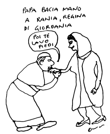
Sopra, a sinistra e al centro: Bergoglio ridicolizza la figura papale con telefonate e manie sportive. Sopra, a destra: Vignetta satirica su Bergoglio che fa il baci mano alla Regina islamica di Giordania, occasione per rammentare anche l’inaudita cerimonia del Giovedì Santo 2013 in cui, in luogo di battezzati adulti a rappresentare gli Apostoli, Bergoglio si è messo indecorosamente a lavare e a baciare piedi femminili e maomettani.

16 - È DA TERZOMONDISTI E DA IMMIGRAZIONISTI aprire le porte ad un’immigrazione incontrollata, dando un segnale di via libera, con la visita a Lampedusa, a tutti i clandestini dell’Africa e dell’Asia, invitati in pratica a trasferirsi qui e a farsi mantenere dagli europei.