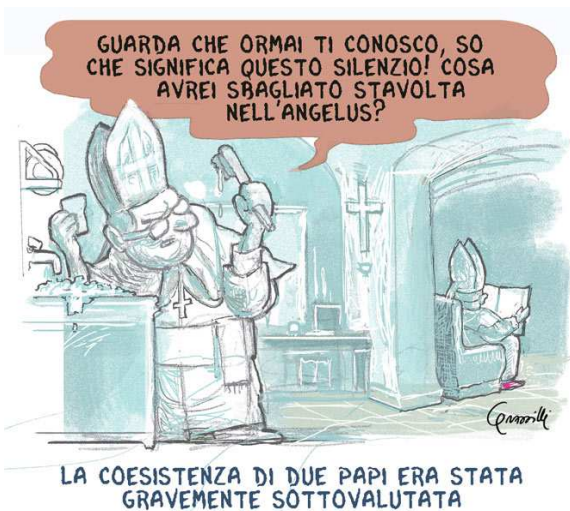
Qui a sinistra: La grottesca situazione di due pseudopapi e di due pseudovicari di Gesù Cristo.

D'altra parte sotto Wojtyła e Ratzinger "fiorivano" i Bergogli, l'uno il dritto, l'altro il rovescio della stessa chiesa conciliare, ch'è tutt'altra cosa dalla Chiesa Cattolica, fino a giungere al ridicolo dei due pseudopapi e dei due pseudovicari di Gesù Cristo.